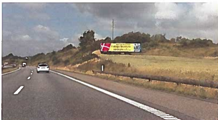
Skiltning ved motorvej – hverken pænt eller hensigtsmæssigt, i forhold til trafikikkerhed.

Der bør desuden være større fokus på, hvordan den øget reklameskiltning vil kunne påvirke trafikikkerheden, især der hvor bilister, cyklister og fodgængere færdes langs samme vejstykke. Det bør overvejes, om der kan gives mulighed for administrative bøder til skilte som kompromitterer trafikikkerheden og til åbenlyst ulovlige skilte.