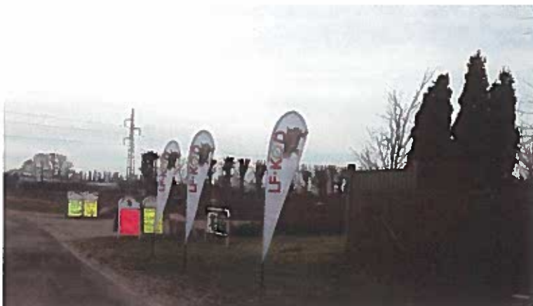
Skiltning i Guldborgsund – gør ikke noget godt for landskabet.

Et konkret eksempel fra forslaget som vil medføre en negativ landskabspåvirkning, som bliver svær at styre er, at kravet om at virksomhedsreklamer ikke må være synlige over store afstande ophæves. Fremover må reklamer gerne være synlige over store afstande, men samtidig må de ikke virke dominerende i landskabet (fx ved at de ikke må blinke eller have lyseffekter). DN tvivler på holdbarheden af denne lempelse. De store virksomhedsreklamer som fremover må være synlige over store afstande vil naturligvis dominere landskabet og landskabsoplevelsen idet et skilt der kan ses over lang afstand, er - dominerende. Skiltet og dermed reklamen bliver et landemærke og kendetegn for et helt landskab.