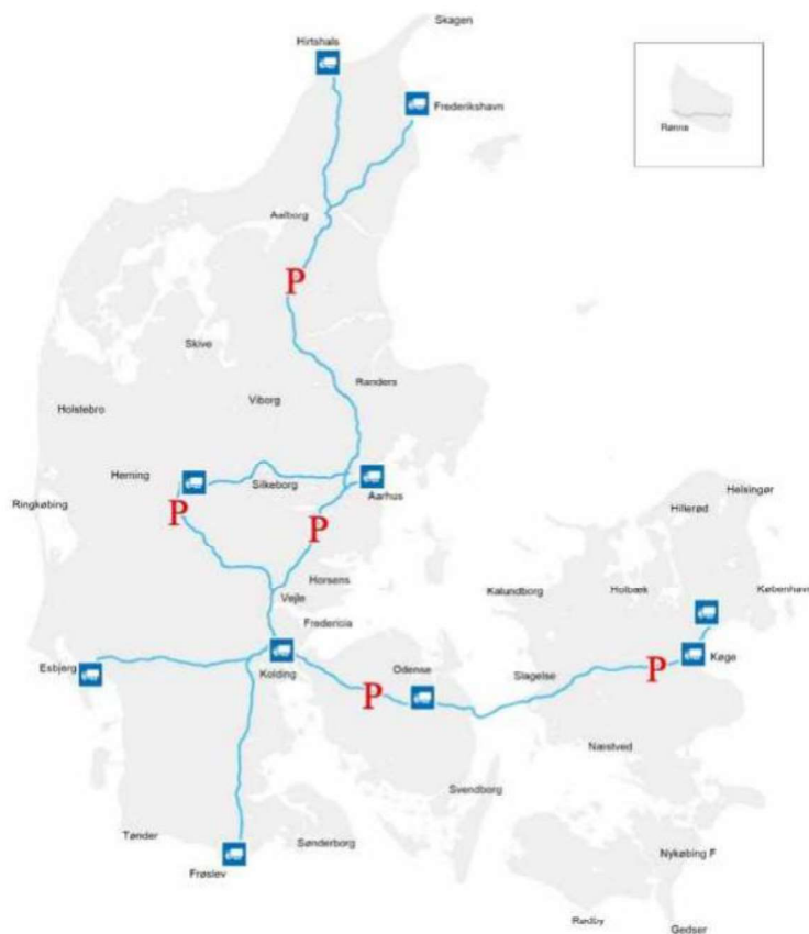
Figur 2. Forslag til forsøgsvejnet samt knudepunkter (omkoblingspladser) og rastepladser

Dog med den tilføjelse at forslaget skal suppleres med nedenstående strækninger