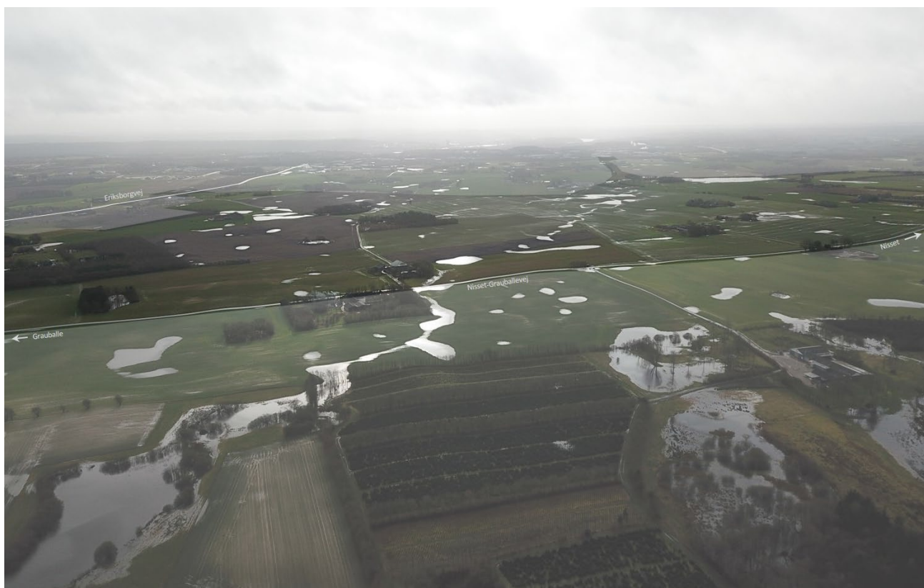
Figur 3. Projektområdet set fra nord mod syd. Silkeborg Langsø og Papirtårnet anes i baggrunden. Arealer udenfor projektområdet er nedtonet. Foto: Anders Mølgaard, februar 2020. Illustration: Anders Busse Nielsen.

Naturlig hydrologi genskabes i det omfang, det er muligt, ved at lukke dræn og grøfter der ikke modtager vand fra naboarealer, og ved at konvertere gennemgående dræn til åbne grøfter/vandløb, der udformes, så de opretholder afvandingsforpligtigelser jf. vandløbsloven.