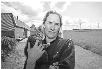
Da hun købte ejendommen så hun ikke møllerne i baggrunden som en trussel. Men det føler hun, da er blevet.

At kommentarerne til lovforslaget fremgår det, at Testcenteret dermed udvider sit interesseområde til 1250 meter hele vejen rundt om møllerne, og dermed kan det blive nødvendigt at fjerne otte nye ejendomme. De otte ejendomme skal i første omgang tilbydes frivilligt opkøb for at skube plads til den femte mølle.