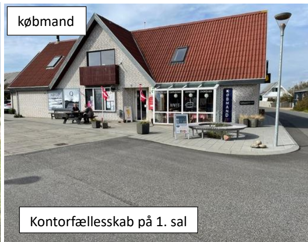
Kontorfællesskab på 1. sal