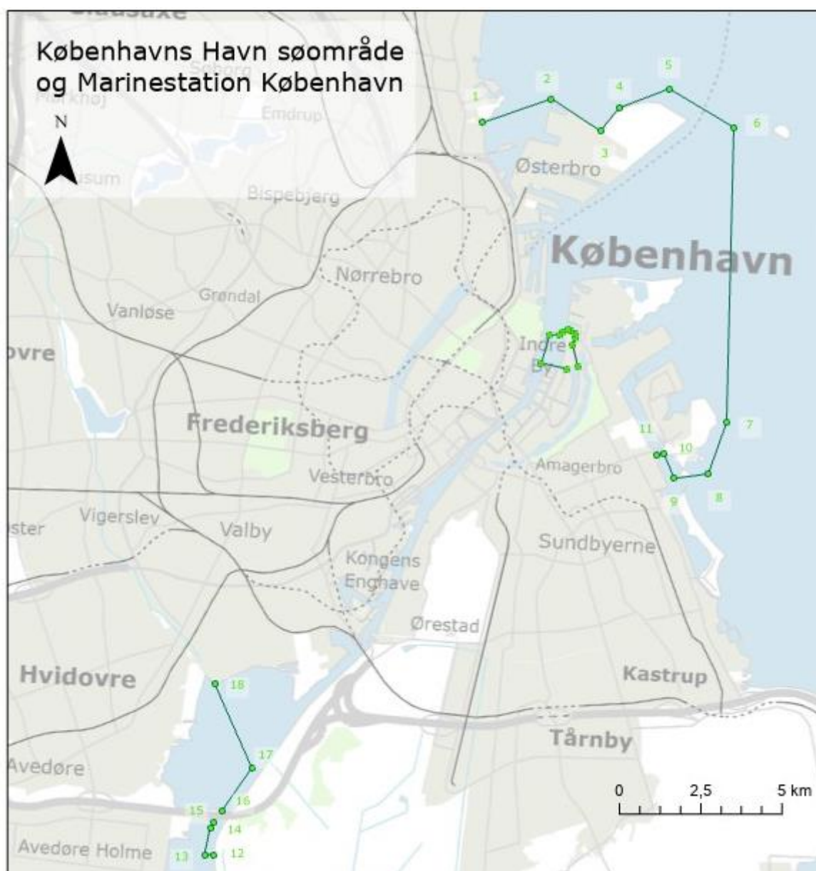
Afgrensning af Københavns Havns søområde