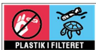
Figur 1. Mærke på tobakspakker og filtre til tobaksvarer

Vi bakker derfor op om, at det fremover skal stå på tobakspakker og filtre til tobaksprodukter, at filterne består af engangsplast, der er skadeligt for naturen.