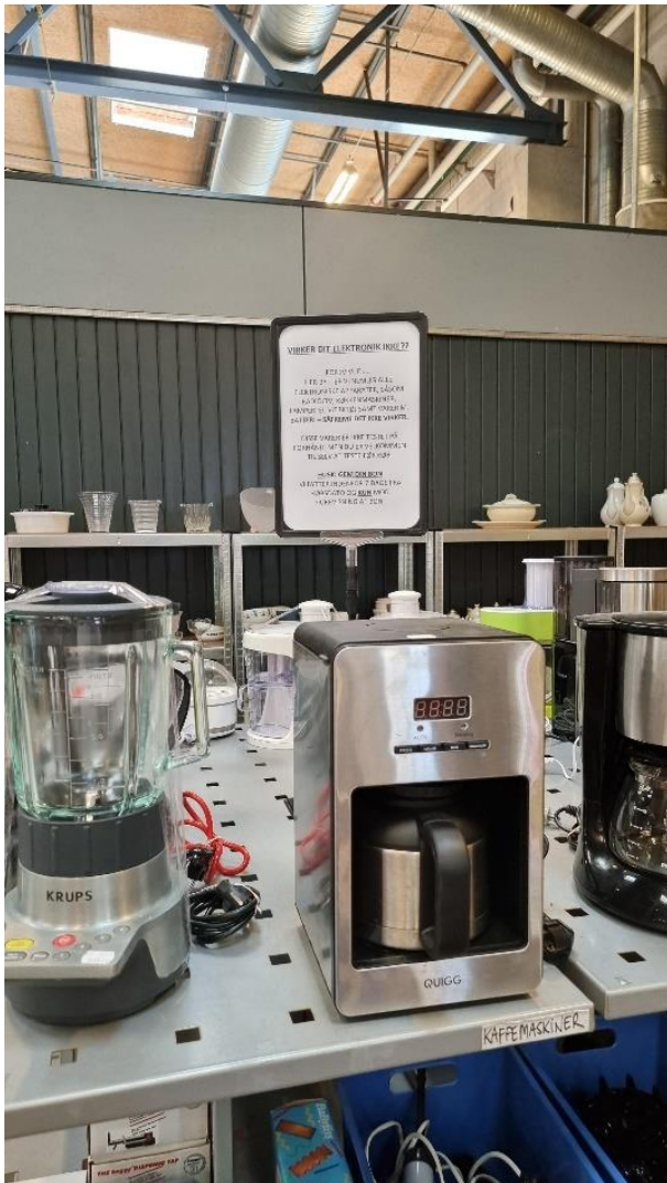
Foto fra kommunalt udsalgsted, hvor bl.a. elektronik afsættes (Danmark, 2022)