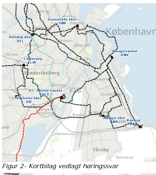
Figur 2- Kortbilag vedlagt høringsvar

Energinet oplyser yderligere, at på søterritoriet ligger eltransmissionsanlæggene retligt ud fra devisen "først i tid – bedst i ret" og dermed også med fuld tilstedeværelsesret. Energinet ønsker bekræftelse på, at den ændrede afgrænsning af Københavns Havns søområde ikke ændrer på retsstillingen for eltransmissionsanlæggene, herunder, at der ikke påføres Energinet nogle omkostninger afledt af bekendtgørelsen.