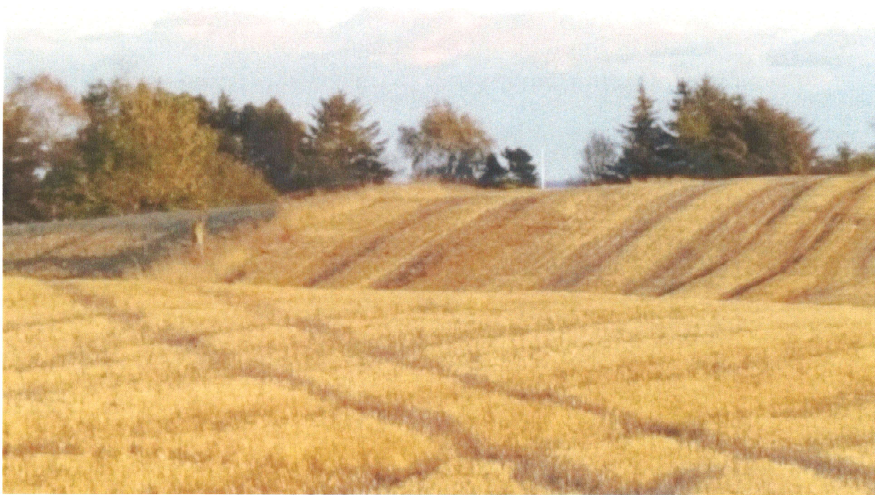
Foto af det foreslåede sommerhusområde set fra Baunehøjvej bag eksisterende sommerhusområde. Fotoet viser det af ØK - udvalget foreslåede nye sommerhusområde foran Holme bestående af små bløde bakker. De fine landskabelige træk vil forsvinde i et sommerhusbyggeri. Foto: Anna Søgaard Nielsen, okt. 2017

Jeg fremsender gerne tegningsmateriale og foto af forslaget om placering af sommerhusbebyggelsen syd for Holme.