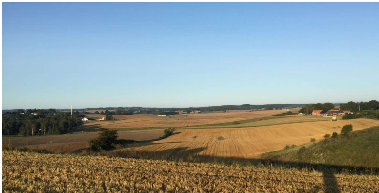
Foto taget fra Ravnsbjerg ved Holme i vestlig retning. Der er frit udsyn helt til Ebeltoft. Holme landsby ses til højre, og det eksisterende sommerhusområde ligger i det bevoksede område til venstre. Det er dette område som foreslås bebygget med sommerhuse. Resultater vil være, at den åbne landskabskorridor ødelægges.

Landskabet langs kysten fra Dråby Strand, forbi Holme/Holme Strand, Hyllested Skovgårde og videre gennem skovene ved Rugård og Katholm gods, helt til Grenå repræsenterer en helt enestående natur og landskabsmæssig værdi. Vælger man at udlægge det foreslåede område ved Holme til sommerhuse, så vil man lægge en kile af bebyggelse ind i landskabet, som medfører, at det sammenhængende natur og landskabsmæssigt enestående område bliver ødelagt. I dens nuværende form, er det en uspoleret landskabskorridor.