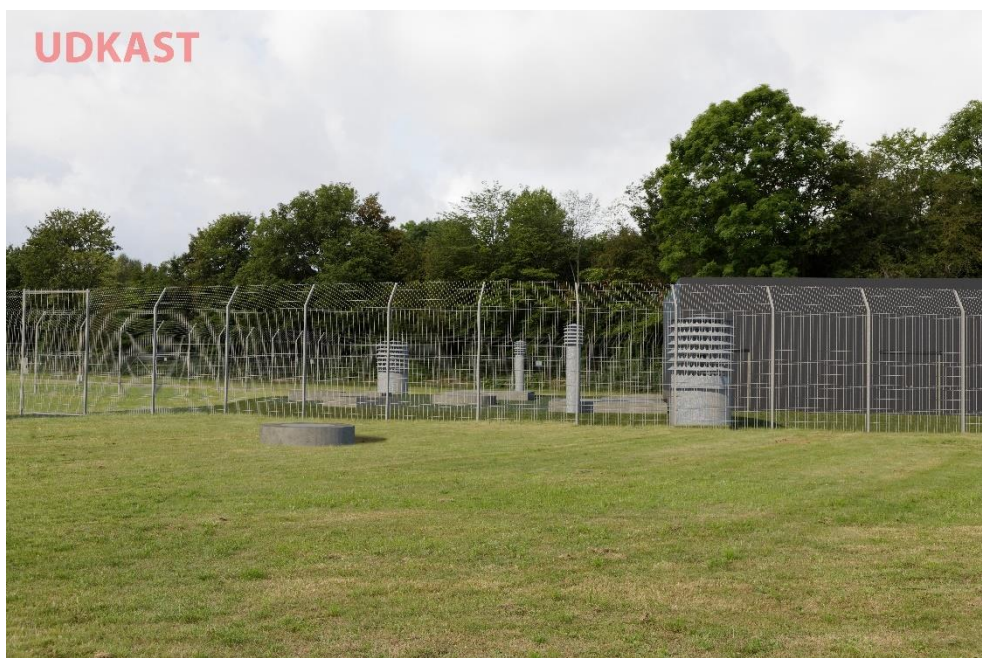
Figur 5-1 Visualisering af overjordiske konstruktioner ved skakten, hvor det øverste billede viser de nuværende forhold og det nederste billede viser en mulig udformning og placering af teknikbygning, adgangsvej, dæksler og udluftningsrør.