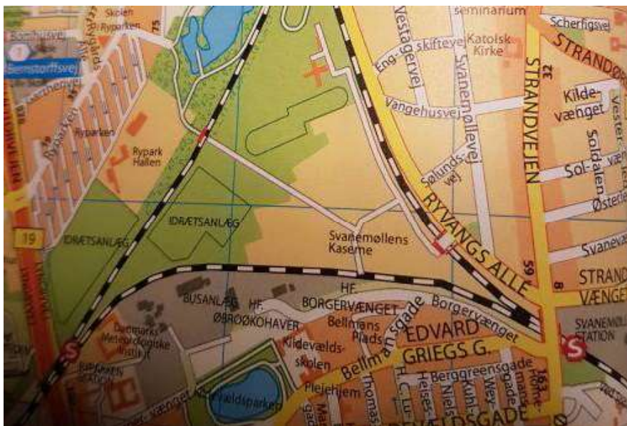
Ældre KRAK-kort som viser linjeføring af stien tværs over arealet.

Der har jo tidligere været stipassage tværs over kaserneområdet. Det ældre KRAK-kort viser linjeføringen af denne sti. Kortet stammer fra et tidspunkt, hvor Nørrebrostien ikke er anlagt, ligesom der heller er nogen udgrening til S-banen mod Farum er at se ved Ryparken Station. Derimod ligger Svanemøllen Station øst for Østerbrogade, hvilket jo også er tilfældet i dag. For mange år siden lå stationen vest for Østerbrogade, men så gammelt er kortet ikke.