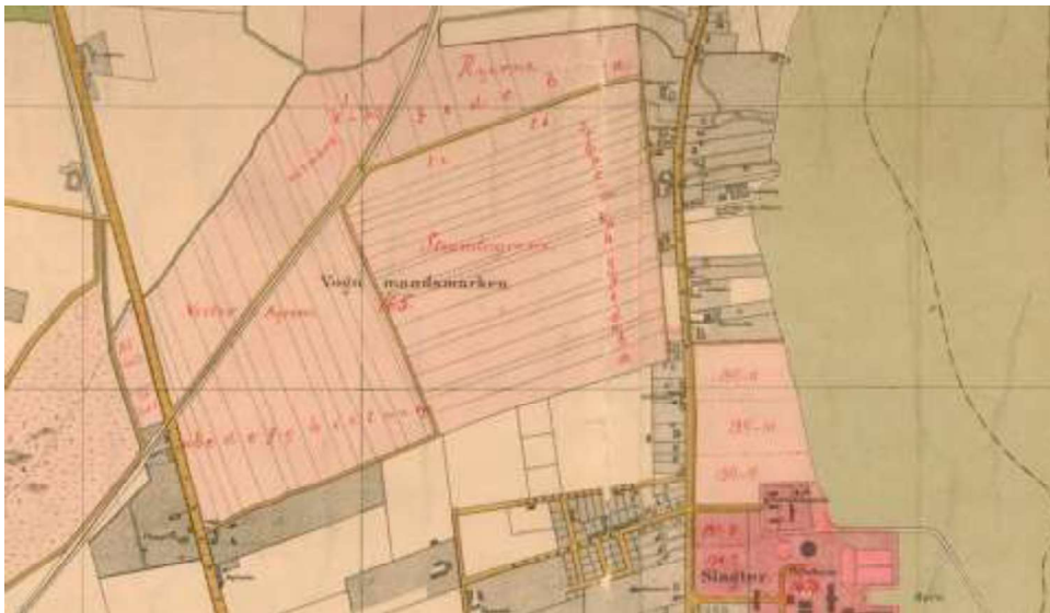
Kortudsnit 1879

Området var tidligere del af Vognmandsmarken, hvor vognmandslavets heste græssede. I 1893 overgik arealet til Ingeniørtropperne. Arealets trekantede form skyldes anlæggelsen af Nørrebrobanen, Kystbanen og Frihavnsbanen omkring år 1900.