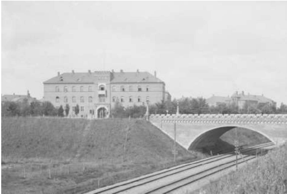
Svanemøllen Kaserne 1900-1910

Området var tidligere del af Vognmandsmarken, hvor vognmandslavets heste græssede. I 1893 overgik arealet til Ingeniørtropperne. Arealets trekantede form skyldes anlæggelsen af Nørrebrobanen, Kystbanen og Frihavnsbanen omkring år 1900.