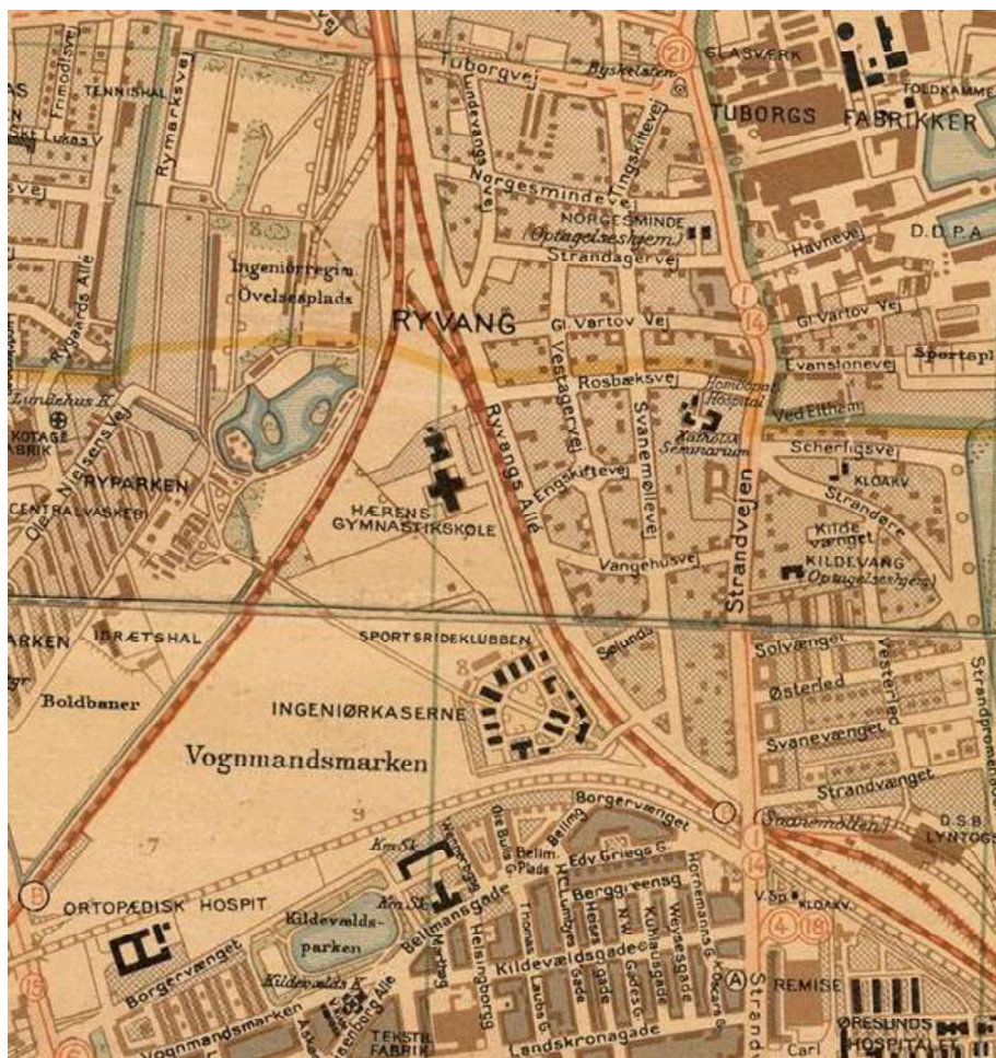
Kortudsnit 1939 fra historiskatlas.dk

Hærens Gymnastikskole ses som den korsformede bygning på kortet fra 1939 nedenfor. Hele idrætsanlægget indgår i de kulturhistoriske bevaringsinteresser.