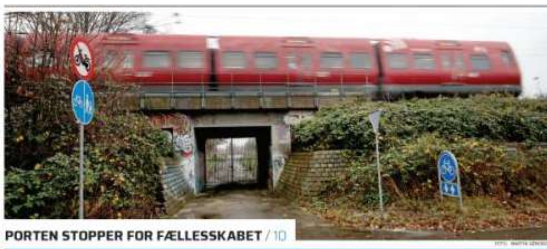
Her ses fra den modsatte side tunnelunderføringen og gitterporten på Ringbanen samt resterne af den tidligere stiforbindelse med belægning.

Så flytter Forsvaret – på trods af Bedre Balance politikken - ikke FE og Forsvarsakademiet til provinsen, så er den næstbedste løsning reetablering af den nedlagte stiforbindelse. Det kræver blot fjernelse af gitterporten under Ringbanen og noget supplerende skiltning.