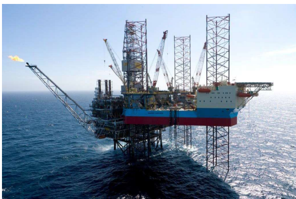
Helikopterlandingsplads på platformen Maersk Inspirer.

Hvis vi tager FE først, så har FE i rigtig mange år – her inkluderet perioden under den kolde krig – haft adresse på Kastellet. Tilsyneladende uden at det har voldt problemer med adgang for befolkningen i området omkring bygningerne. Havde det været tilfældet, så var FE nok fraflyttet Kastellet for adskillige årtier siden. Det er svært at forstå, hvordan situationen skulle ændre sig, fordi FE fordi flytter til den nye adresse på Svanemøllen Kaserne. Den kolde krig er forlængst forbi, og potentielle fjender er både blevet færre i antal, og grænserne er flyttet længere væk.