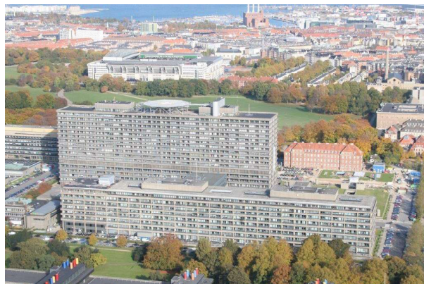
Helikopterlandingsplads på taget af Rigshospitalet.

Heller ikke undskyldningen om sikkerhed ved helikopterlanding lyder troværdig. Helikoptere bruges i dag til mange formål. Offshore industrien bruger dem særdeles intensivt. Og her er landingspladserne meget små. De ligger enten udkraget fra platformen eller på et mindre areal af dækket på seismik- eller forsyningskibe. Mon ikke det skulle være muligt at finde en afkrog på kasernearealet til et sådant formål?