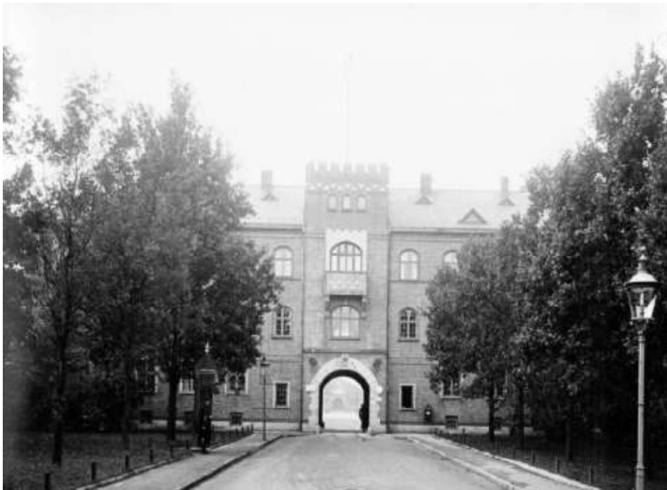
Svanemøllens Kaserne 1922